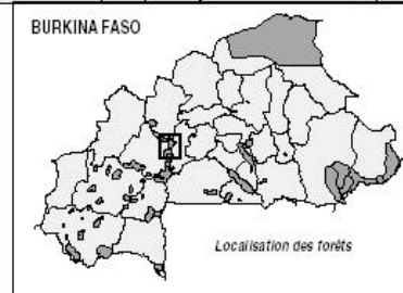
Situation des villages riverains de la forêt classée de TIOGO